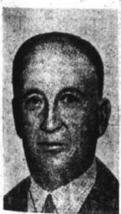
Largo Caballero Jefe del Gno. de Valencia