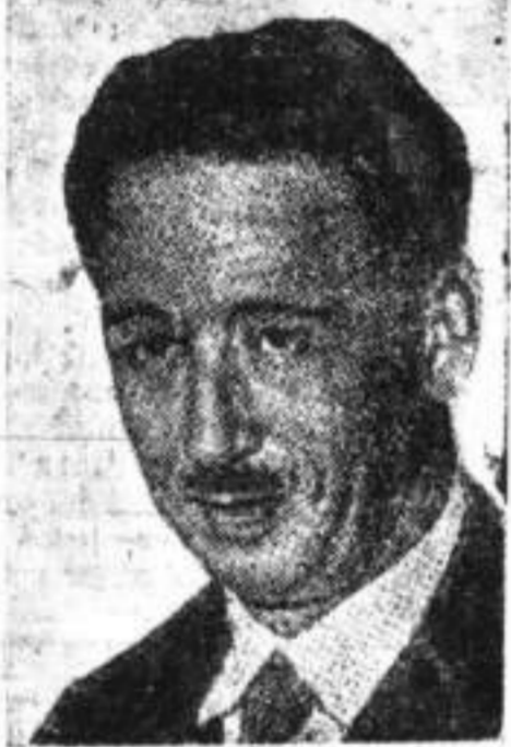
Luis Companys Jefe del Gno. de Barcelona