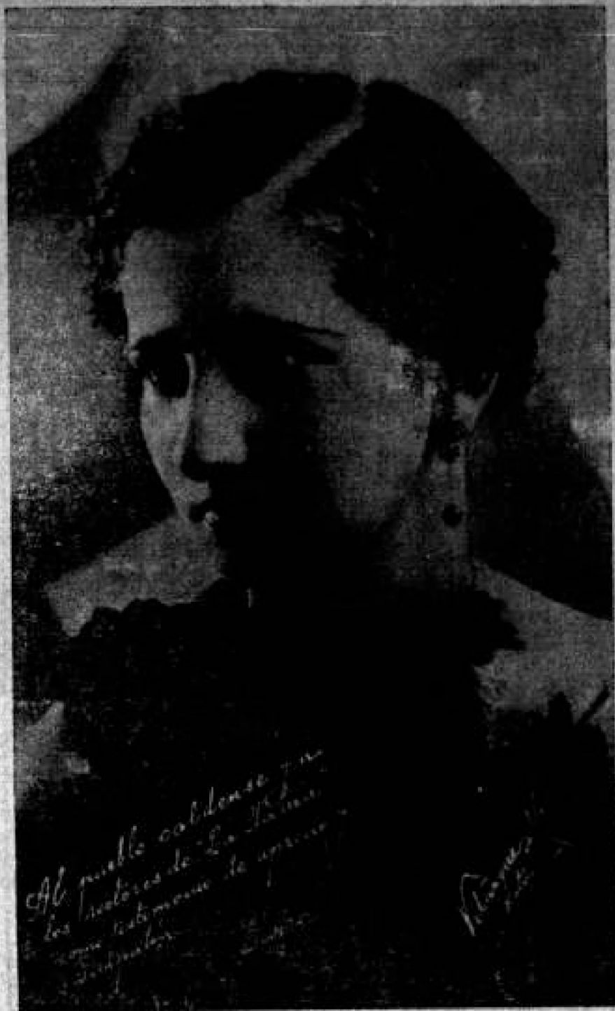
Del Carnaval Cartagüeno.