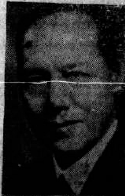
Dr. Olaya Herrera