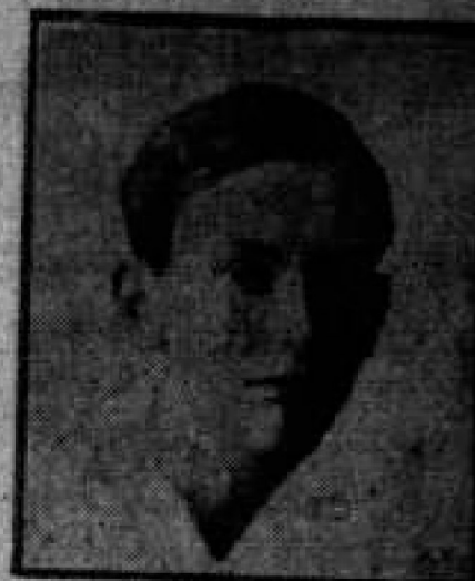
Alberto Lleras Camargo

las relaciones entre Inglaterra e Italia y continúan complicadas las cosas en Europa, especialmente por lo que se relaciona con estos dos países.