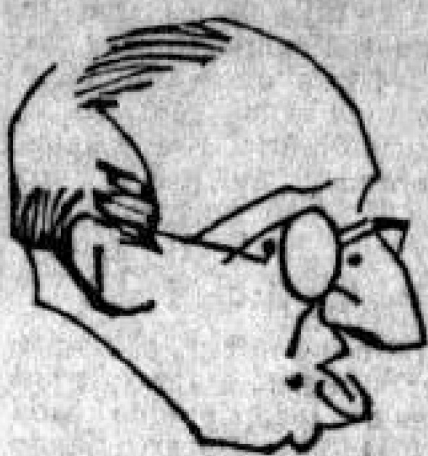
Soto del Corral

Consagrado el nuevo Obispo de Manizales. Emilio Toro Gerente de la Caja Agraria. "El Diario Nacional" ataca a los senadores enemigos del impuesto al patrimonio. Lleras Camargo Visita la Corte Suprema. Nuevo ministro del Perú en Colombia. Sensacionales noticias.