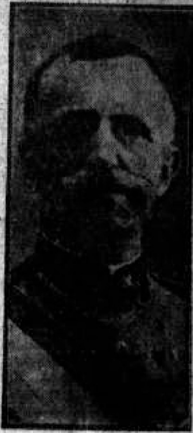
S. M. Victor Manuel Rey de Italia