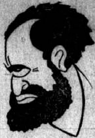
Haile Selassie Emperador de Etiopía