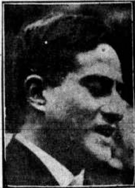
Dr. Darío Echandía

dos repudiando totalmente la política fiscal y social del gobierno del Dr. López y de las Cámaras legislativas; se licitan además del Congreso actualmente reunido, que se plice las reformas constitucionales por un término de tres años, mientras se conserven vuelven a ocupar las funciones que les corresponde en los cuerpos colegiados, especialmente en el Congreso. Manifiestan que no se consideran jurídicamente vinculados a ninguna reforma que se haga por parte de las cámaras liberales, especialmente en lo que se relacionan esas reformas con ataques al Clero, matrimonio civil, divorcio, régimen de la propiedad, intervencionismo de estado, etc.