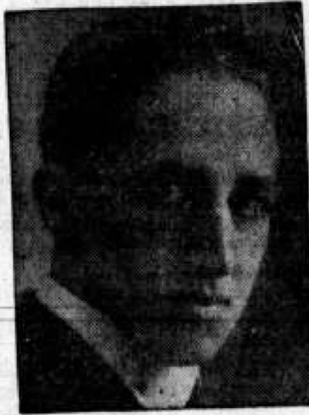
Soto del Corral