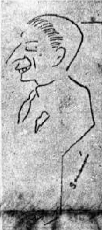
Dr. Jorge Eliécer Gaitán

prenta donde se edita el periódico "La Patria".