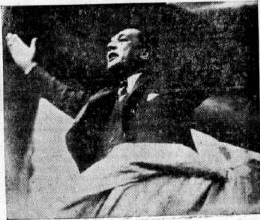
Dr. Laureano Gómez