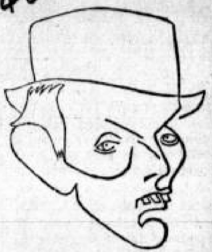
Alberto Lleras Camargo

Ha sido objeto de innumerables comentarios el formidable editorial que publica ayer tarde 'El Espectador' y en el cual critica en la forma brava que las necesidades lo exigen la actuación torpe del clero político antioqueño que mediante la propaganda de acción católica, incita violentamente a las masas para que se lan-