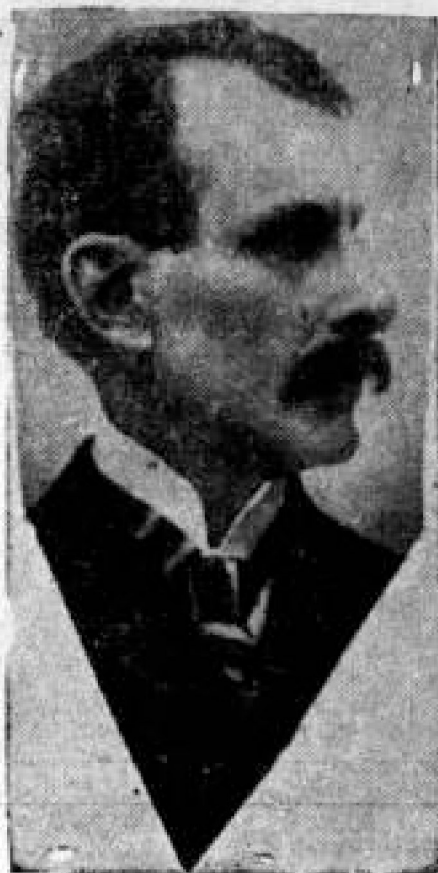
Rafael Uribe Uribe

Se cumplen hoy y desde la fecha infausta en que rodó sobre las gradas del Capitolio Nacional, el coloso de América, Rafael Uribe Uribe. Creemos como el más oportuno homenaje que podamos rendir a su memoria, reproducir un capítulo de su bella obra "Las grandezas de la Patria," que él escribiera para homenaje y loa a Colombia, que fue su más grande amor, su máxima aspiración y su ideal constante.