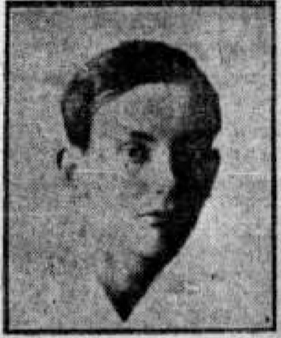
Alberto Lleras Camargo