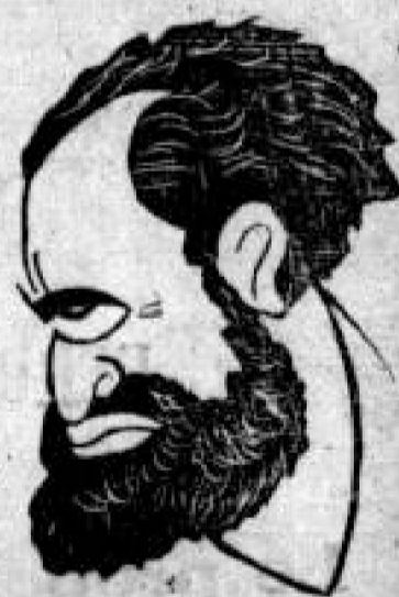
HAILE SELASSIE Emperador de Etiopía