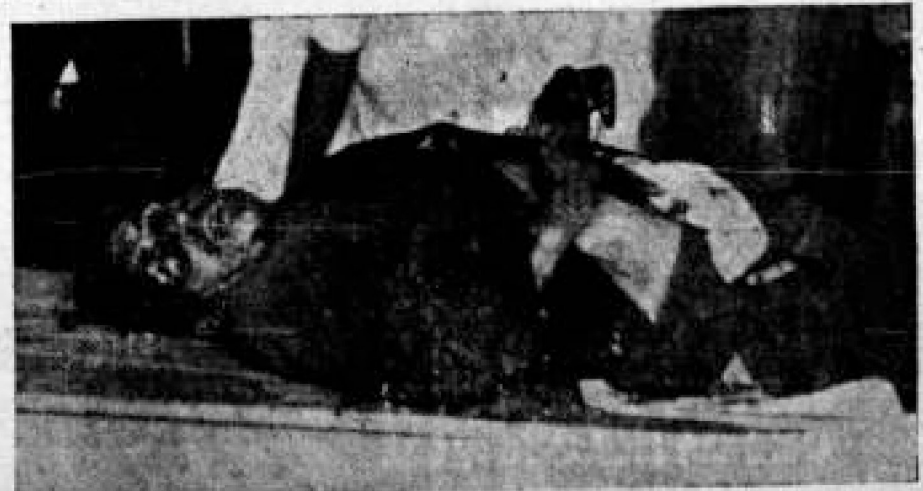
PE-PE El cadáver de este Holguín después de recibir 30 minutos de resaca