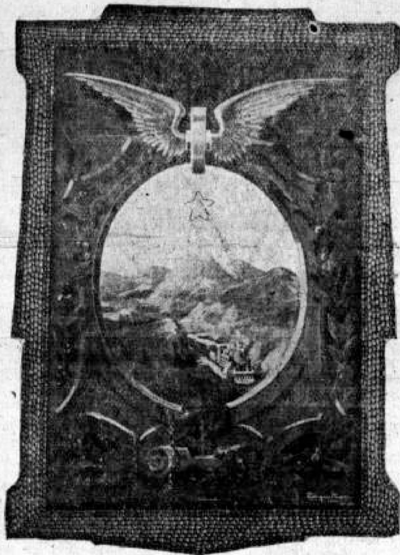
El Escudo de Pereira