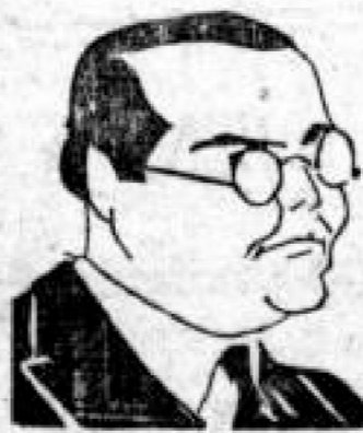
El Senador Caicedo Castilla