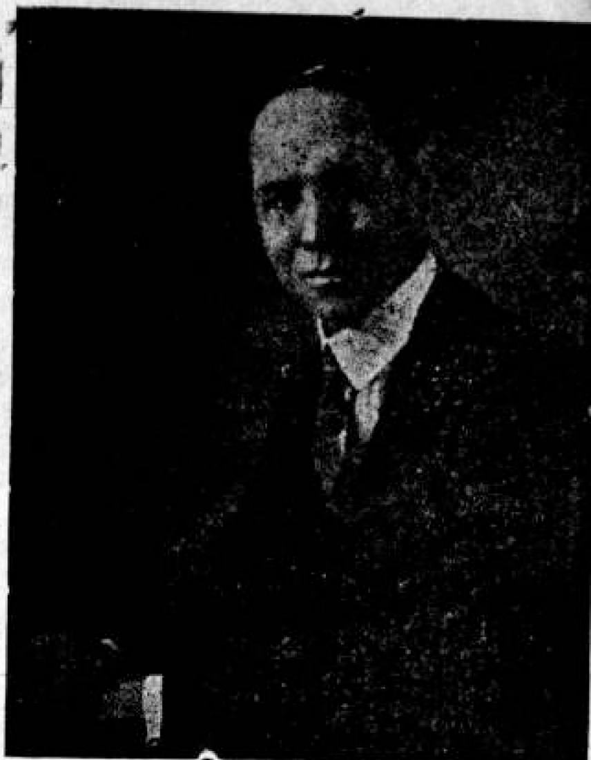
Dr. Enrique Olaya Herrera