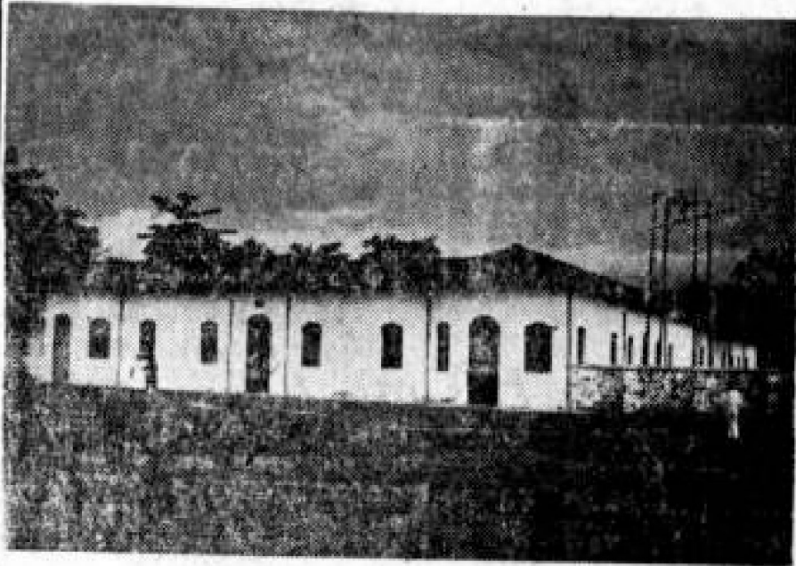
HOSPITAL DE LA DORADA

cajas de seguridad de "El Guavito" y en residencias particulares de altos jefes del ejército y de destacados políticos conservadores se han encontrado documentos que comprometen seriamente al conservatismo y a muchas unidades del ejército.