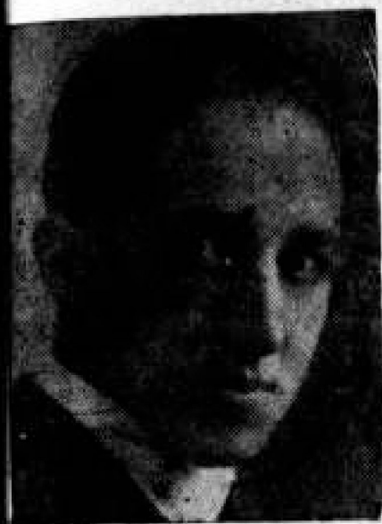
Soto del Corral