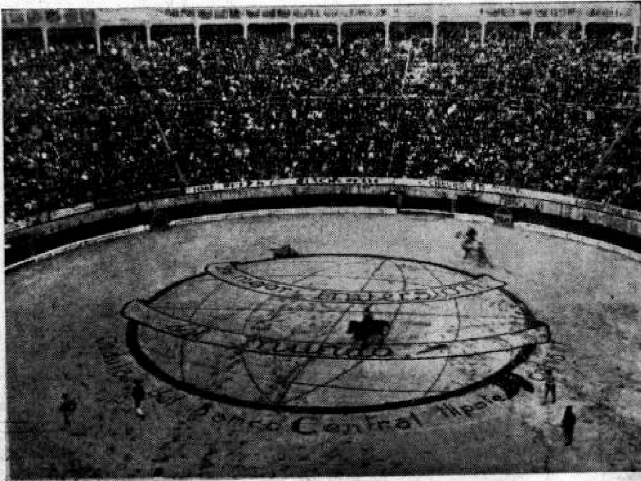
14.000 espectadores pudieron contemplar el artístico aviso del Banco Central Hipotecario en la corrida a beneficio de la Cruz Roja Nacional, en el Circo de Toros de Bogotá.

Cédulas del Banco Central Hipotecario. La mejor inversión del Mundo.