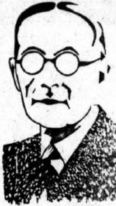
Dr. Alfonso López

Trascendentales reformas presentará el Gobierno al próximo Congreso.- Reforma del Concordato. Se estudia la apertura del Canal del Atrato.- Emisión de quinientos mil pesos en monedas de plata.