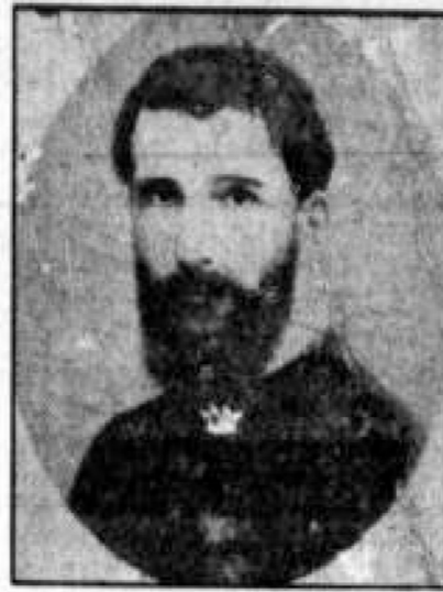
José Asunción Silva

En un día como el Silva de hoy al amanecer, dentro de una aurora pobre y opaca, los familiares de José Asunción Silva encontraron a... esdáver en el lecho, pues pocas horas antes un balazo certero lo apartó de la tragedia de su vida y lo enrumbó definitivamente hacia la inmortalidad. La obra de Silva, ya justamente apreciada y consagrada, es sin duda alguna, de las pocas que en este país —tan lírico pero tan ingrato— han logrado sobrelivir y perpetuarse. Sus libros ruedan de mano en mano, sus versos son profusamente publicados en periódicos