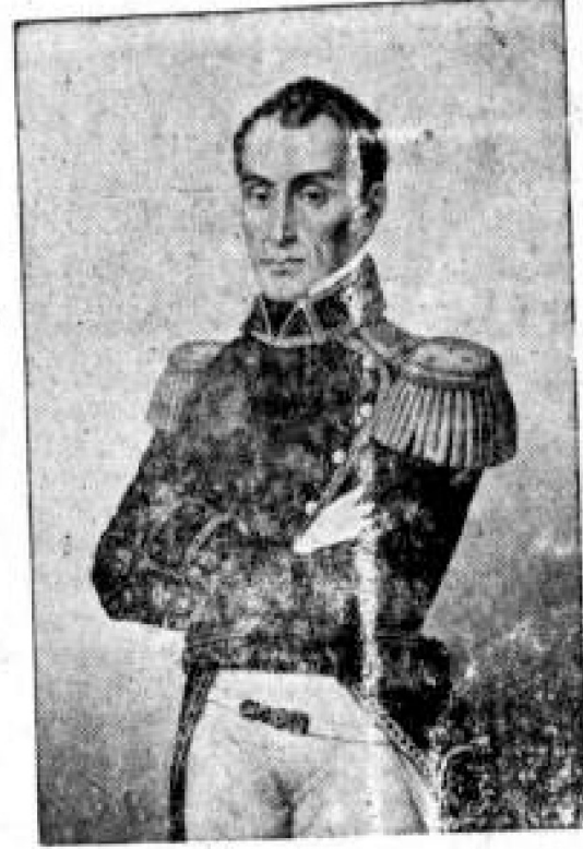
Libertador: Si no Bolívar

En una de las veces que el Libertador, derrotado por sus enemigos o traicionado por los suyos, necesitó huir de Venezuela, el azar le llevó a Jamaica, donde espe-