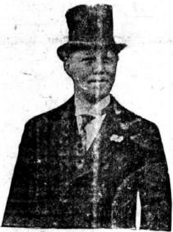
Dr. Enrique Olaya Herrera

Sigue la conmoción por el siniestro del superavión ruso. El asesi- nato de Miró Quesada provoca una crisis Ministerial en el Perú. Noticias de todo el mundo.