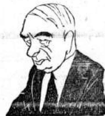
Don José Ayala

Presidente del Paraguay, país que ayer celebró la fiesta de su independencia.