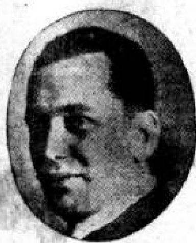
Dr. Laureano Gómez

Reformas en la plancha de ese departamento. Se busca la manera de prescindir los contratos con las misiones extranjeras. En Popayan se proclama solemnemente la plancha directorista. Varios.