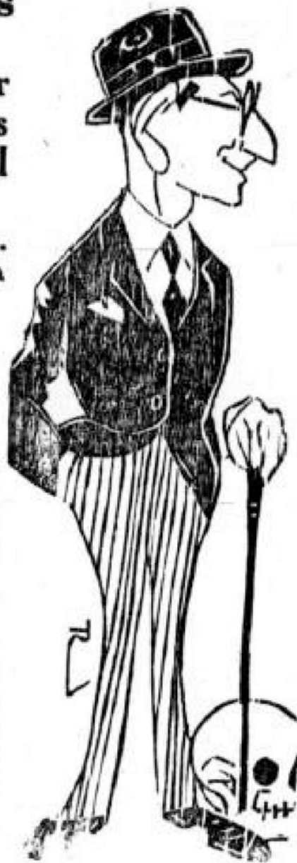
Dr. Gabriel Turbay

—Llegan noticias, procedentes de Medellín, en las cuales se informa que desde el sábado pasado estalló una enorme huelga en las minas de Segovia, en la cual toman parte activa 400 trabajadores. Piden los mineros que se les hagan algunas concesiones, y especialmente que se les cambie el trato que actualmente reciben. A unas de las peticiones de los trabajadores accedieron los patrones, pero no así a otras entre ellas, las de mejor trato y la huelga continúa. El gobierno despachó ayer un piquete del ejército a órdenes del Capitán Moreno Díaz y 20 guardias de Antioquia con el teniente Angel, los cuales llegaron apenas mañana en las horas del medio día. Los