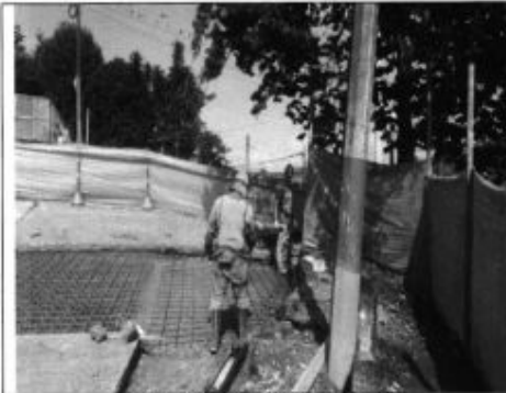
Fotografía No3: Poda Radicular