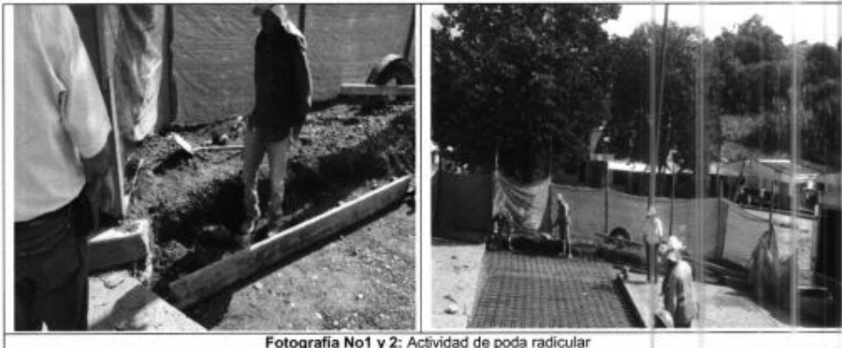
Fotografía No1 y 2: Actividad de poda radicular

Teniendo en cuenta la actividad de poda radicular realizada por parte del contratista el día 27 de octubre de 2017, la cual se evidencia en el registro fotográfico del presente comunicado, se requiere al contratista presentar los soportes ambientales correspondientes (permiso ambiental para la poda), que avalen la ejecución de esta actividad, así mismo efectuar la respectiva cicatrización de raíces y de más acciones que deben estar contempladas en el respectivo permiso, que garanticen la supervivencia de este individuo arbóreo.