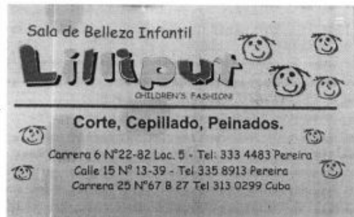
Ilustración 3- Tarjeta de la peluquería