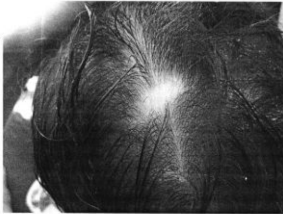
Ilustración 2- zona notablemente afectada