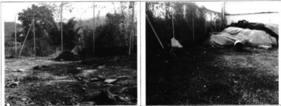
Fotografía No. 3 y 4- Zonas sin retiro de material sobrante