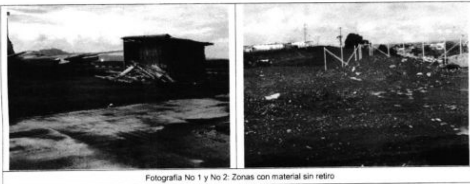
Fotografía No 1 y No 2: Zonas con material sin retiro

Teniendo en cuenta que han transcurrido 22 días desde la terminación de la obra, cabe aclarar que el contratista se encuentra incumpliendo con lo establecido en el Plan de Manejo Ambiental el cual fue aprobado para la ejecución de la obra, donde estipula en su numeral 9.1 "PLAN DE ABANDONO Y TERMINACIÓN DE LA OBRA": "...El Contratista deberá retirar los materiales, equipos e infraestructuras sobrantes del proyecto...Retiro de todos los escombros y residuos similares y según las medidas del Programa de Manejo de Residuos Sólidos y de Construcción. Desmontar el/los campamentos utilizados Revisión final sobre el terreno, para asegurar que no existan residuos que posean potencialidad contaminante, conforme trampas, obstáculos o que su permanencia afecte la integridad de la armonía paisajística que se pretende..."