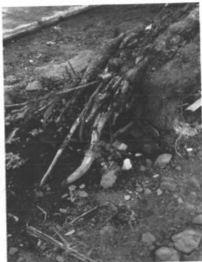
Árbol Casco de Buey