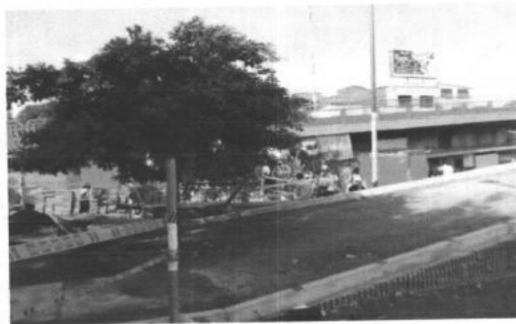
Árbol para realizar poda