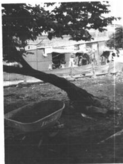
Problemas de volcamiento