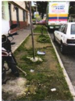
Zona de traslado de individuos forestales