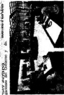
Los partes negociadores esperan llegar pronto a los últimos acuerdos y así alcanzar la firma de la paz.

Este es el que pactaron para que esa organización juegue el acompañamiento requerido en las llamadas zonas de concentración.