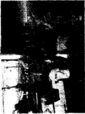
Reciclar es el acompañamiento que tienen las comunidades subindustriales que son beneficiarias de la planta de reciclaje, cuyo objetivo es orientarlas en la compra de la comunidad, aportando a la disminución de su deuda en la Empresa de Energía".

fuerte, separación de residuos, para finalmente poder pagar una cantidad de dinero por ellos.