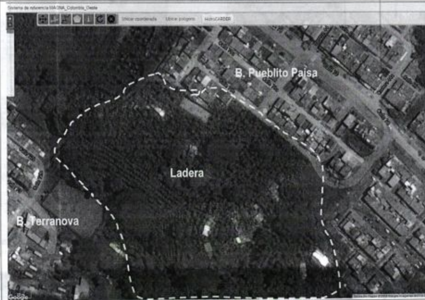
Descripción: Ubicación B. Pueblito Paisa y Terranova frente a la ladera