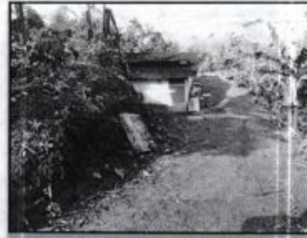
Foto 4. Viviendas a media ladera