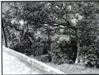
Foto 1. Aspecto de la cobertura vegetal en la corona de la ladera

Descripción Cultivos transitorios como plátano, pasto de corte, banano, maíz, yuca y permanentes como café, aguacate y algunos frutales