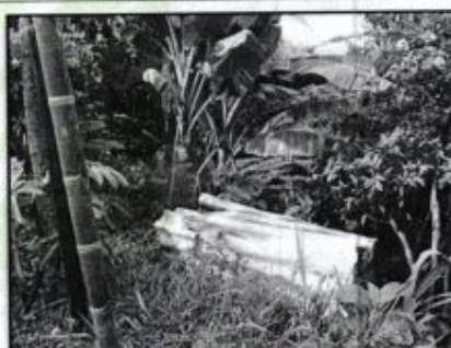
Foto 2. Otros usos en la corona de la ladera

Descripción Disposición final de basuras y escombros de construcción