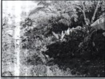
Foto 3. Tipo de vegetación y viviendas en la media ladera