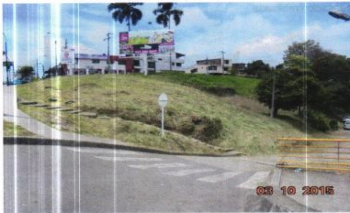
Estado inicial del sector del Retorno 3