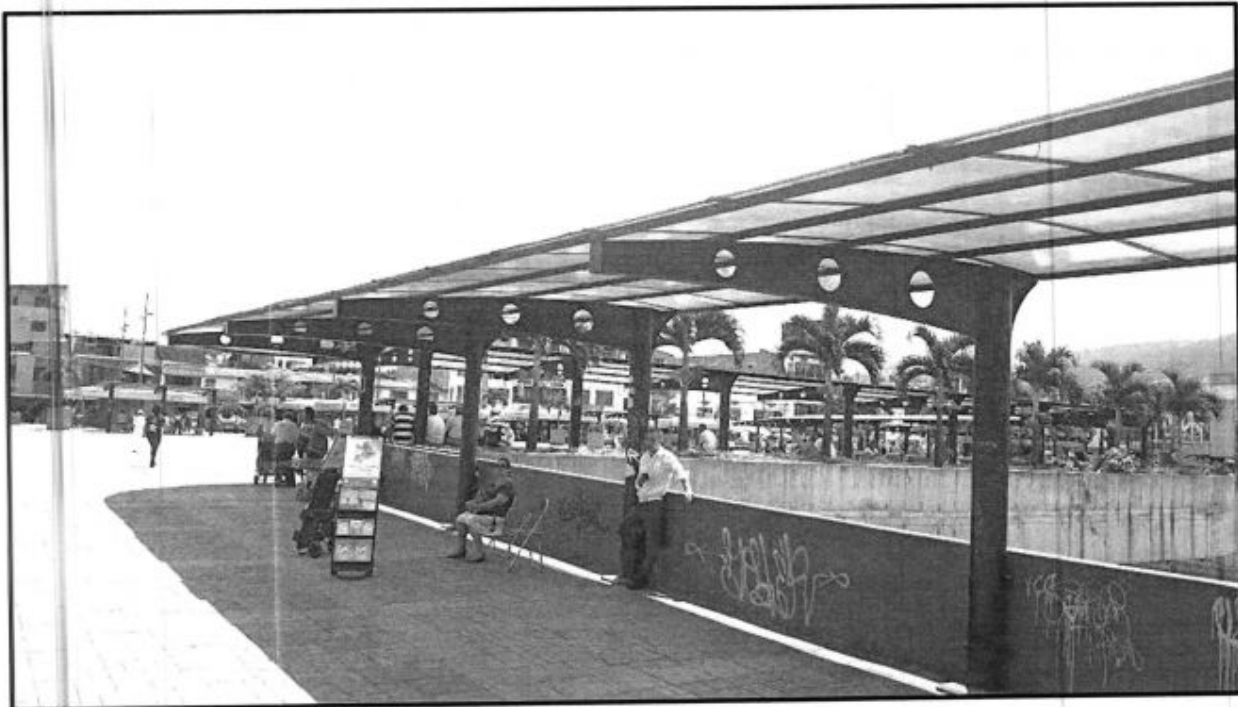
FOTO ESPACIO SOLICITADO PARA LA ACTIVIDAD