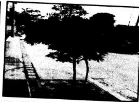
Adecuación (desinfección, fertilizantes) y siembra de árboles.