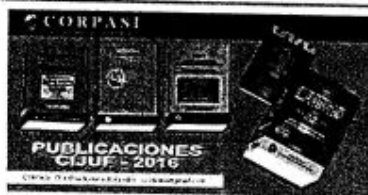
PUBLICACIONES 2016.jpg 956K