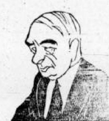
JOSE AYALA Presidente del Paraguay