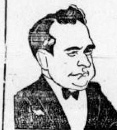
DANIEL SALAMANCA Presidente de Bolivia.