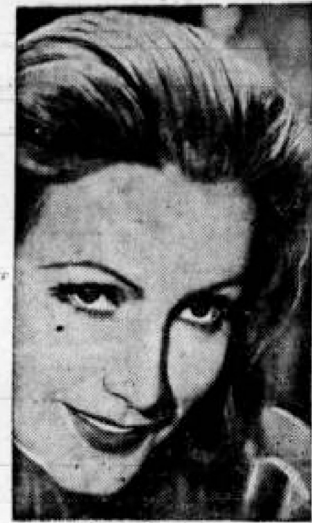
Greta Garbo in "Queen Christina"

Gran éxito parlante de la Casa Metro Goldwyn Mayer. No deje usted de admirar por última vez, este monumento del cine moderno.