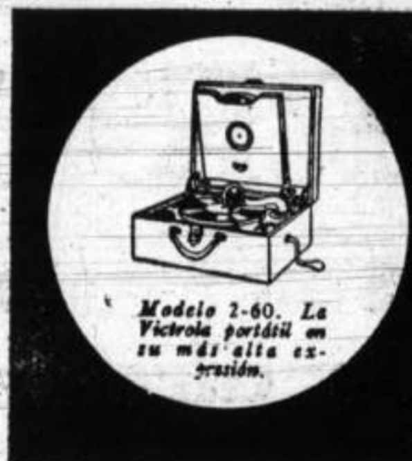
Modelo 2-60. La Victrola portátil en su más alta expresión.

Sea cual fuere su fortuna, hay una Victrola al alcance de Ud. El comerciante Victor de la localidad le enseñará exquisitos modelos en todos los tamaños y estilos. Será un momento de placer para Ud. y a la vez una grata sorpresa. Visítelo hoy mismo.