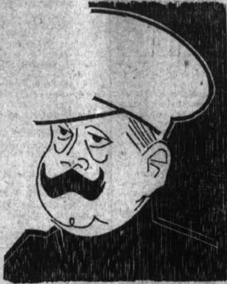
GENERAL FRANCISCO J. DIAZ.

Los formidables carteles de prevención que fueron fi- jados de orden de la direc- ción de la policía nacional, le dieron al público la sensa- ción precisa de que contaba con el apoyo de las autorida- des. De estos carteles ya les había hablado en la corres- pondencia de ayer, pues ellos fueron remitidos a los perió- dicos y a las estaciones ra- diofónicas para que se le- yesen a todo el mundo. También se dio a conocer po- co después, otro cartel fir- mado por el general Jorge N. Soto, director del servicio de circulación y tránsito, con iguales y más severas prevenciones para los oposi- tores a la movilización de es-