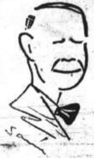
Dr. Olaya Herrera

-Comunicaciones de Nemocon, avisan que tanto las minas de carbón de ese lugar, como las de Suesca, Sesquilé y Chocotá, presen-