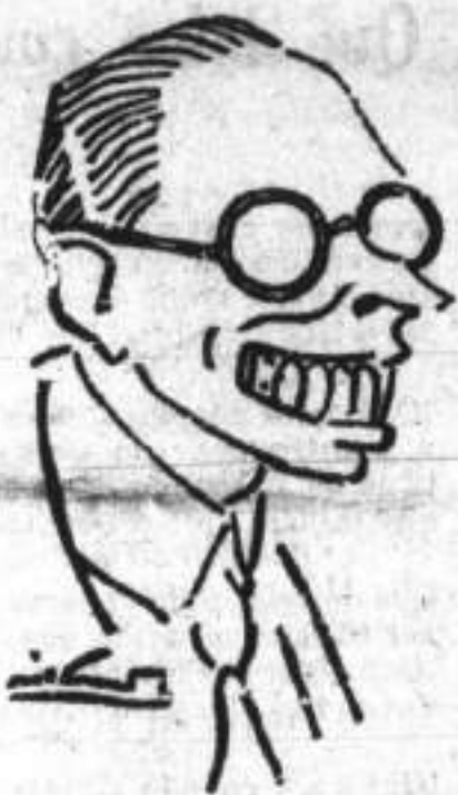
Dr. Alfonso López

Fracasaron las gestiones de paz que venían haciendo desde días atrás los Dres Laureano Gómez y Alfonso López. Los conservadores manifestaron ayer a las directivas liberales que esta vez no han sido afortunados en sus gestiones, por que a pesar de haber puesto todo su empeño, no fue posible de inducir a los jefes conservadores a variar de forma ante el empeño de éstos en oponerse a las medidas convenidas por el gobierno nacional y ordenadas por la ley. La entrevista que concede el jefe es sumamente larga y en ella manifiesta que el gobierno estuvo dispuesto en todos los momentos a colaborar eficazmente en el empeño nobilísimo de buscar la paz en algunas regiones en donde feroces bandoleros han acabado con ésta.