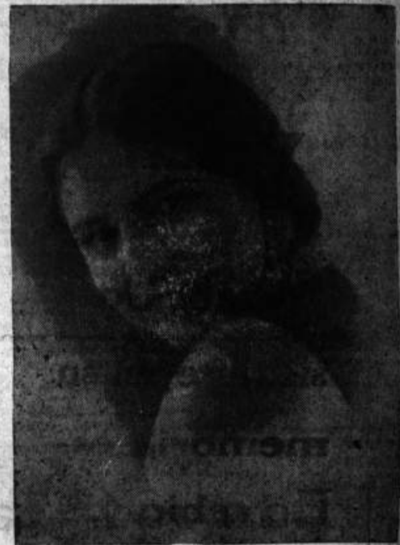
Quien visitará esta ciudad próximamente