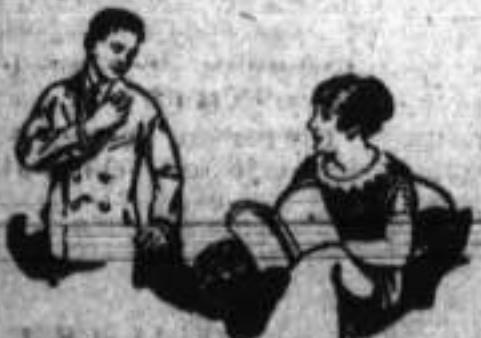
SU MEJOR AMIGO

es el mejor purgante conocido, el más delicioso y el más eficaz.