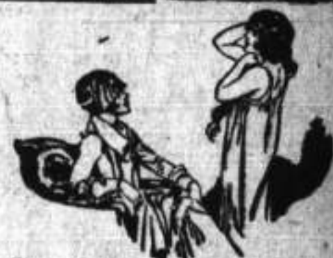
Su íntima amiga