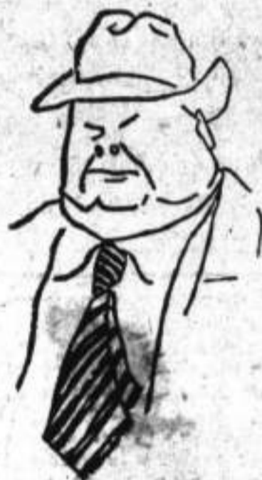
GRAL. VASQUEZ COBO

-Los peruanos continúan asegurando que obtuvieron nuevos triunfos en Guepi y que las tropas colombianas sufrieron en ese sitio el más violento decalabro. El Sr. Ministro de la Guerra, capitán Uribe Gaviria dice que esas informaciones carecen de veracidad, pues que actualmente no hay ninguna novedad en aquellas regiones y que todos los partes llegados hasta el momento están acordes en afirmar que no hay nada nuevo y que las posiciones conquistadas por Colombia, permanecen todavía en nuestro poder y que todos los días son más fortificadas.