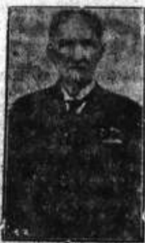
DR. ANTONIO JOSE RESTREPO