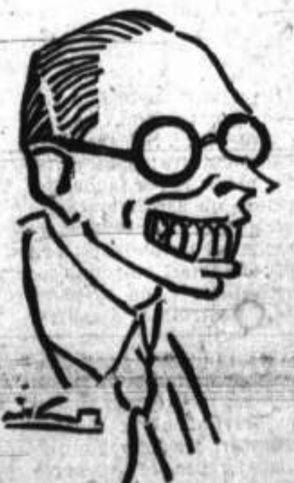
Dr. Alfonso López

proclamado candidato para la Presidencia de la República en el periodo 1934-1938.