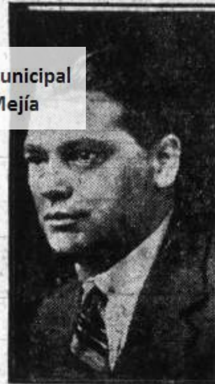
Biblioteca Pública Municipal Ramón Correa Mejía

suelen acompañar estos debates y que de sucederse comprometerían de modo grave el éxito de la tarea máxima y primordial reclamada a todos los colombianos en la hora presente, cual es la defensa de la integridad territorial, del decoro y de la dignidad nacionales; pero si la noble idea lanzada por ustedes ha de tener una amplia acogida y eficaz ejecución, sin duda alguna podrán renovarse parcialmente los poderes públicos sin trastornos de orden interno y sin perjuicio para la seguridad exterior de la república.