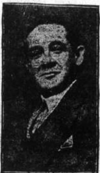
GRAL. MORALES CLAYA

El Ministro de Gobierno Gral Morales Olaya, en reportaje concedido a la Agencia Sin hizo fuertes censuras contra uno de los órganos periodísticos de esta ciudad,