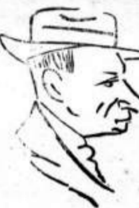
Visto por San...