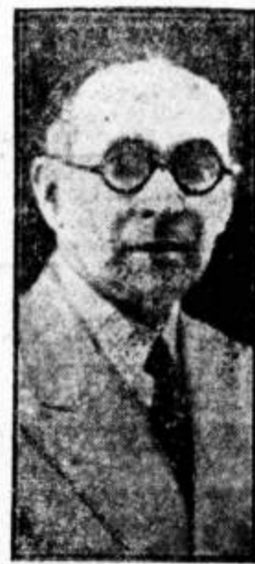
DR. ALFONSO LOPEZ

Una importante conferencia entre dos eminentes jefes liberales.